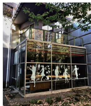
ロビー1階・2階窓の外観

ロビー1階・2階は、東と南に面した全面開放型 の窓になっています。春は新緑、夏は木立（こ だち）の緑、秋は紅葉・・・と続けたいところだ ですが、今年は気象の影響か紅葉は少しばかり 遅れている模様です。真冬になれば雪景色も 楽しめるのでしょうか？見た目にも四季を感じら れる緑センターの窓景色は自慢のひとつです。