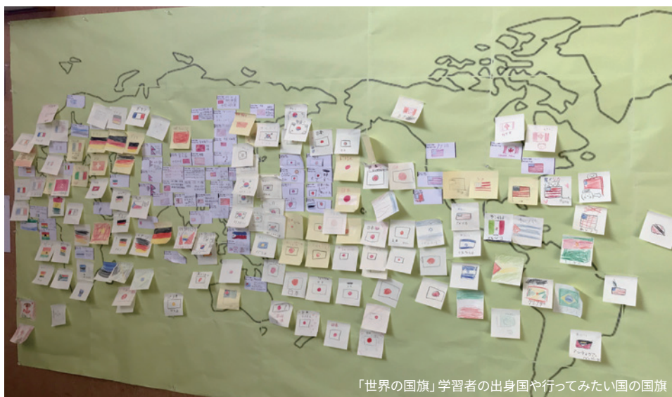
「世界の国旗」学習者の出身国や行ってみたい国の国旗